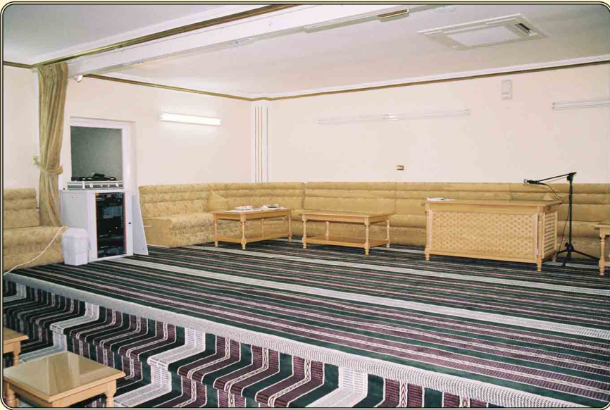
مقدمة قاعة المحاضرات والاحتفالات